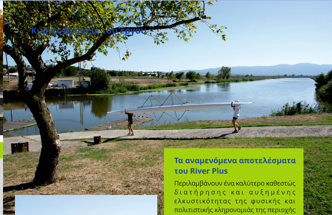
Κύριες δράσεις του έργου